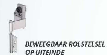
BEWEEGBAAR ROLSTELSEL OP UITEINDE