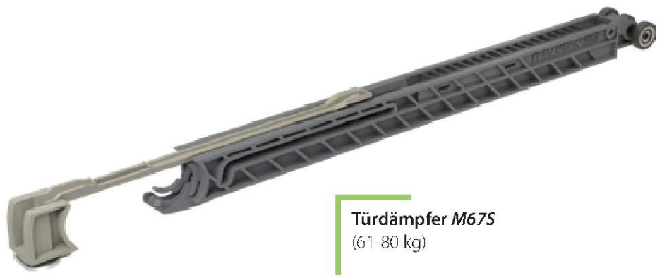
Türdämpfer M67S (61-80 kg)