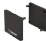
11052C Satz Abschlusskappen - schwarz