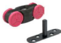
SAF Rollwagen und Platte