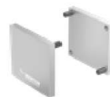
11052D Satz Abschlusskappen - naturfarben