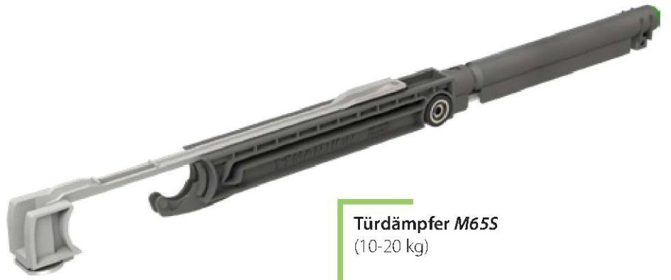
Türdämpfer M65S (10-20 kg)