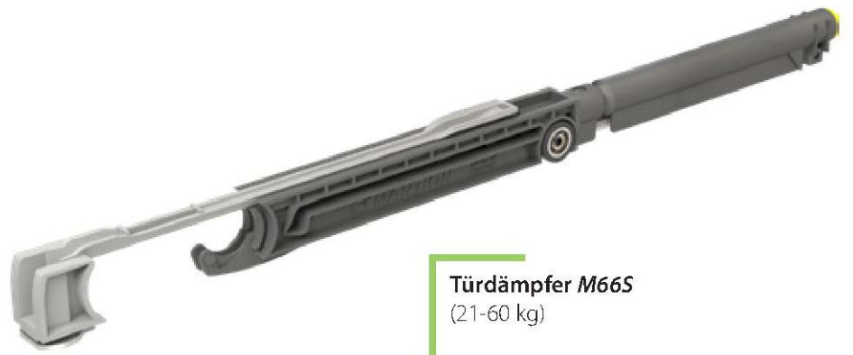
Türdämpfer M66S (21-60 kg)