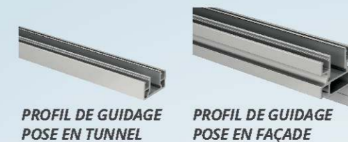
PROFIL DE GUIDAGE POSE EN TUNNEL