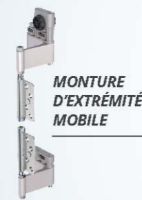
MONTURE D'EXTRÉMITÉ MOBILE